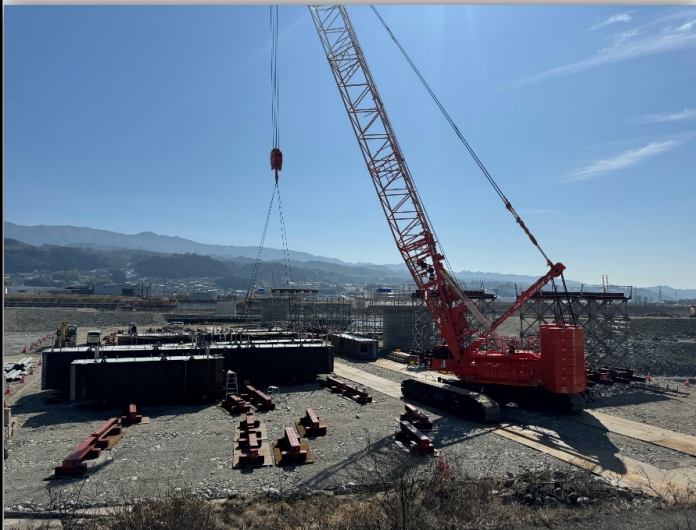
地組状況 (200tクローラクレーン)

当現場は360°カメラを設置して事務所、スマホ等どこでも現場を見れる様にしています。