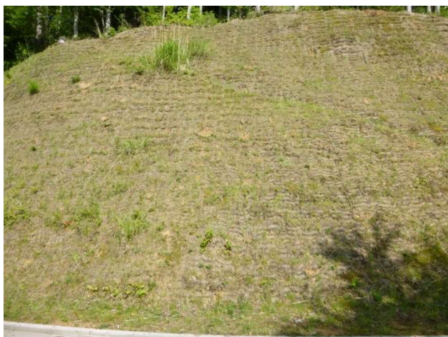
試験前状況(食害により裸地化)

アーチブロック有無の試験区を設け、経過状況を確認した結果、アーチブロック有りでは植物が伸長し、植生被覆を達成することができた。