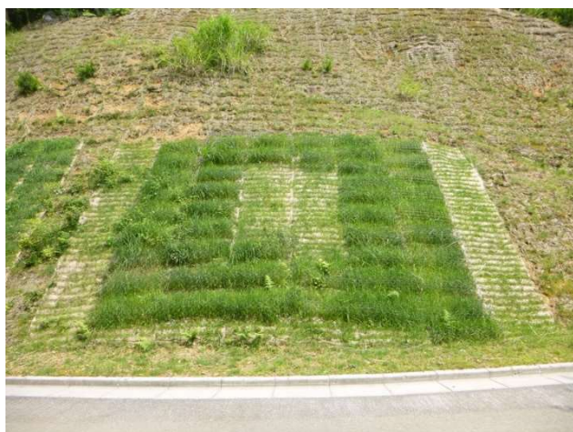
H26 年 6 月(6 か月経過)