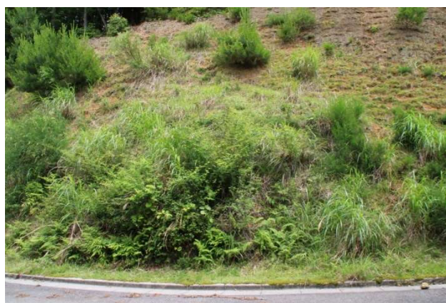
R 元年 6 月(5 年 6 か月経過)

発注者：－ 現場名：滋賀県米原市内 工法名：ガンリヨクマット5型＋アーチブロック 施工時期：H25 年 12 月